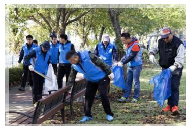
<1사 1하천 살리기 운동>