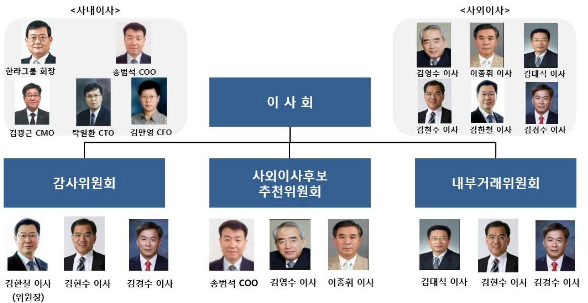
<표2. 위원회 구성현황>