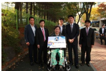
<사랑의 오뎅이 휠체어>

넷째, 환경보전입니다. 당사는 각 사업본부 별 주변 지역의 산과 하천에 대한 자연 정화 활동에 앞장서고 있으며, 정부 기관에서 실시하는 각종 자연보호 캠페인에 적극적으로 동참하여 우리의 자연을 가꾸고 보존하는 일에 앞장서고 있습니다. 주요 활동으로 1사 1하천 살리기 운동, 1사 1산 운동, 저탄소 녹색경영 협약, 쓰레기 정화활동, 에너지 절약 캠페인 등을 전개하고 있습니다.