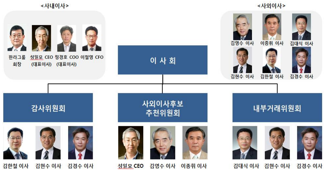
<표2. 위원회 구성현황>