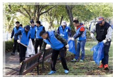
<1사 1하천 살리기 운동>