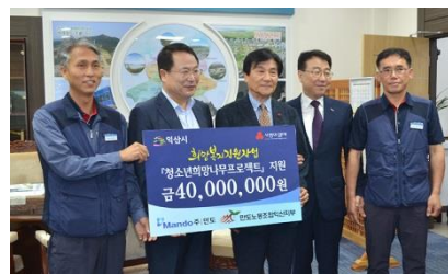
<청소년 희망나무 프로젝트 장학기금>